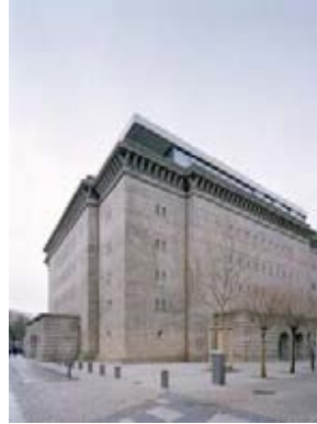
Aussenansicht des Bunkers der Sammlung Boros in Berlin, Foto: © Noshe

But if you want to prevent robbery from ever occurring, just do what Christian Boros did in Berlin. He exhibited his collection in the safest of places: in a bunker.